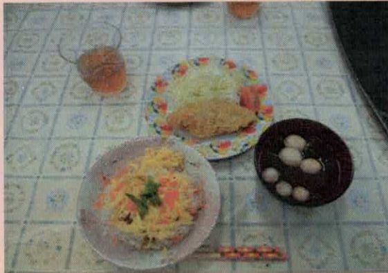
ちらし寿司、白身魚のフライ、 菜の花のすまし汁